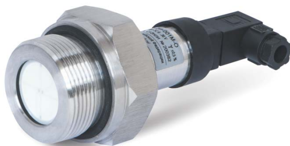
Исполнение "резной датчик"