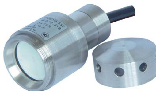
Исполнение "погружной зонд"