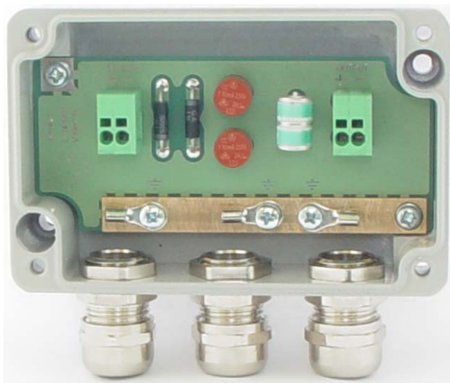
Монтажная коробка со снятой крышкой