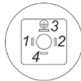
DIN43650 C Вилка

9.4. Подсоединение проводов линии связи к клеммам коннектора производится в соответствии со схемой электрических соединений (приложение В) с соблюдением правил раздела 10. Расположение контактов на вилке электрического соединителя (коннектора DIN43650C) приведено на рис 1. Диаметр кабеля для присоединения к коннектору не должен превышать 7,5 мм.